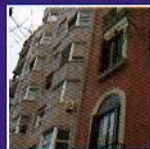
GESTIÓN INMOBILIARIA El precio de la vivienda está sobrevalorado hasta en un 20%