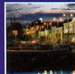
MERCADO EXTERIOR Finlandia, mucho más que madera y telecomunicaciones